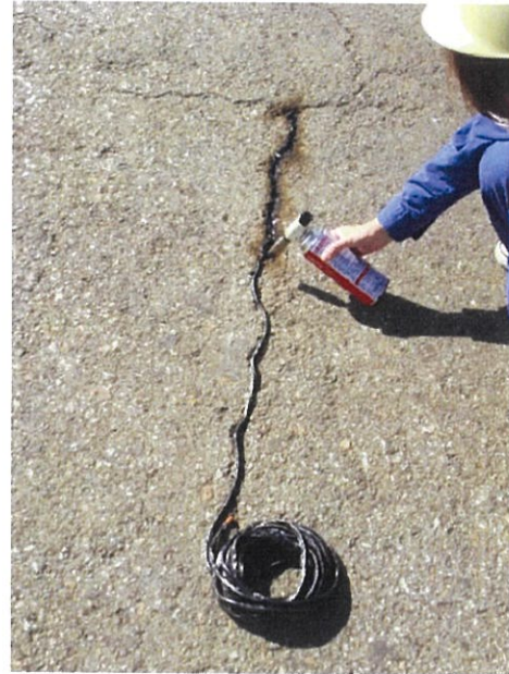
線状クラック補修状況