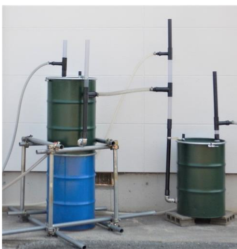
油の粗取りとスラッジやSSの除去なら DDトラップとDDフィルターだけで処理できます