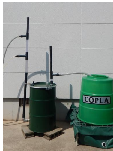
油とSSの精密除去は DDフィルターと コプラオイルフィルターで対応できます