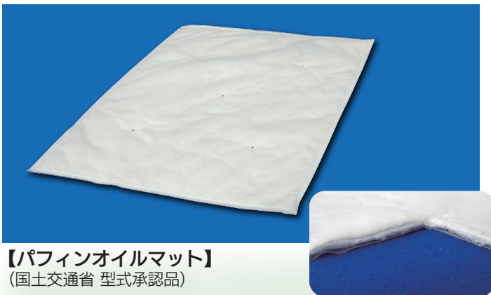
【パフィンオイルマット】 (国土交通省 型式承認品)

φ1 μm のマイクロファイバーで構成された吸着綿が油をすみやかに回収し、逃がしません。 油を吸った後も、従来のオイルマットより、浮力を保持します。