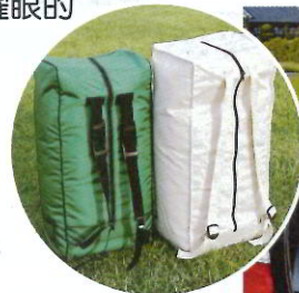
▲ 肩挎背包双用型 为可背型